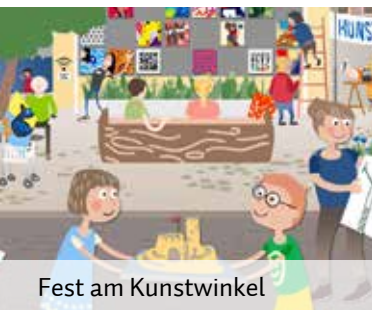
Fest am Kunstwinkel