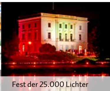
Fest der 25.000 Lichter